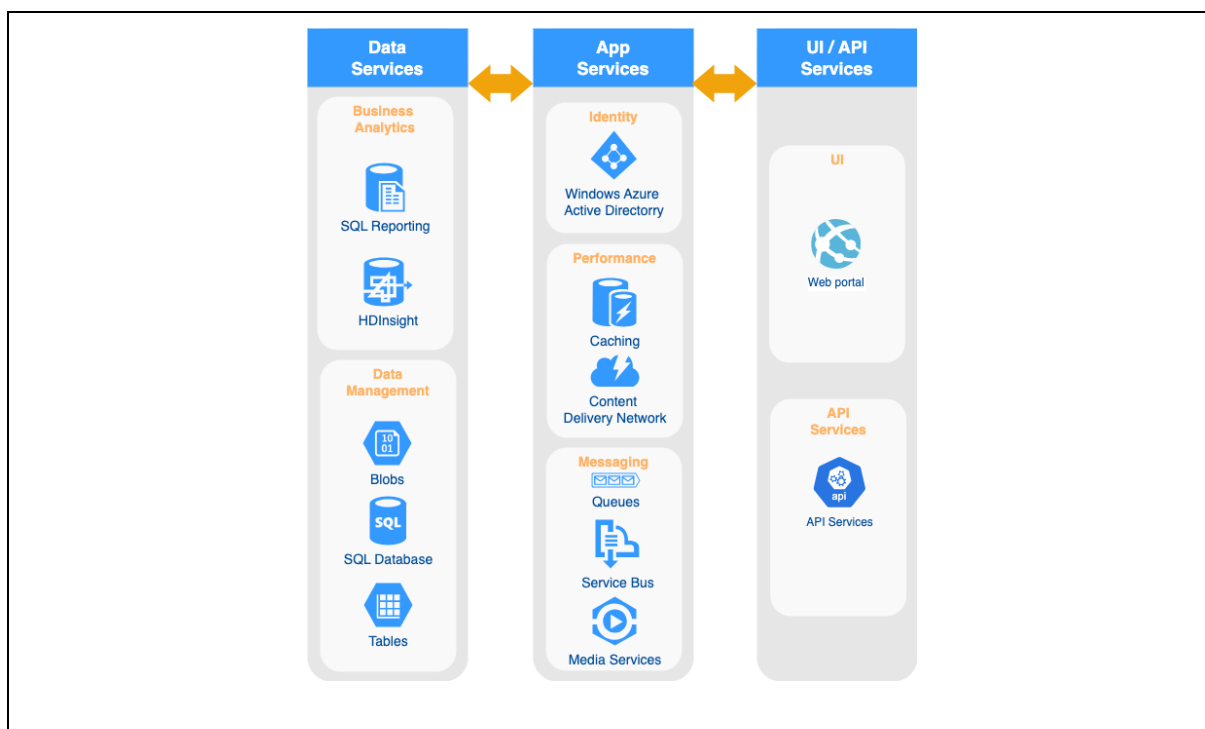
Obr.2 Architektúra systému

Konfigurácia systému bude prebiehať pomocou najnovších nástrojov Microsoftu (Visual Studio, Azure DevOps Server). Zdrojové kódy budú ukladané do verzionovacieho úložiska Azure DevOps Server, ktoré je pravidelne zálohované. Prístup je monitorovaný a chránený menom a heslom. Po každom odoslaní nových zmien do Azure DevOps Server bude prebiehať komplexná kontrola integrity zdrojového kódu. Závislosti v rámci systému budú vytvorené pomocou technológie NuGet. Po každom produkčnom release sa vytvorí nová vetva (branch), ktorá sa použije v prípade fix-u produkčnej chyby. Pri návrhu, implementácii softvéru a výbere komponentov sa zohľadňuje odolnosť voči najčastejším bezpečnostným útokom. Veľký dôraz kladieme na testovanie. Testovací tím je oddelený od programátorského a členovia sú certifikovaní pomocou ISTQB®. Pri návrhu systému sa berie ohľad na možnosti automatizovaného testovania. Pred každým nasadením sa bude vykonávať testovanie na základe testovacích scenárov. Prototyp systému bude prevádzkovaný v testovacom a vývojovom prostredí. Tieto prostredia sú dôležité pre dodržanie kvality prevádzky a riadenia zmien systému. Nasadzovanie prototypu systému do uvedených prostredí bude prebiehať plno automatizovane, aby sa minimalizovali riziko ľudskej chyby. Ďalšou dôležitou časťou systému je kvalitný a komplexný monitoring, ktorý je nevyhnutný pre podporu prevádzky systému.